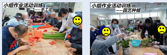
患者在治疗室进行小组作业活动训练

小组作业活动是作业治疗中的一项创意活动，旨在通过团体合作和动手操作，帮助患者提升精细动作能力、手眼协调、认知功能，同时促进情感交流和心理健康。