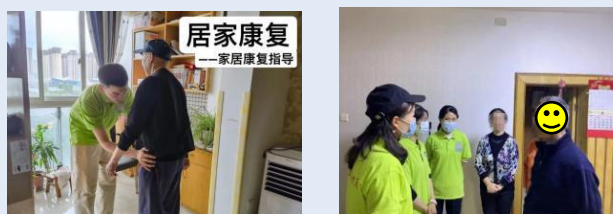
在患者家中提供康复指导，帮助患者适应日常生活

家访不仅帮助我们更好地了解患者的居住环境，还能针对性地提供康复建议，更是一种心理上的支持与鼓励。患者在熟悉的环境中康复，能更融合的参与日常生活。