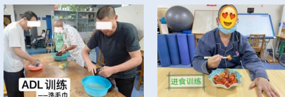
患者在治疗室内专注参与日常生活的练习

治疗性作业活动是作业治疗中的核心部分，根据患者的具体情况设计并实施个性化的康复训练。图中的中风后遗症的患者便是我工作中的一些典型例子。他们的侧肢体功能严重受限，日常生活难以自理。为了帮助他们恢复生活能力，我为他们安排了包括握力训练、穿脱衣物、洗漱、使用餐具等一系列日常生活模拟训练。