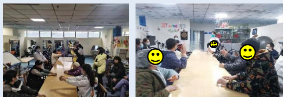
对患者及家属进行出院前康复指导

患者在医院的康复虽然至关重要，但如何将这些技能带回家，才是确保康复成功的关键。在出院前，我们通常会为患者提供居家康复指导，帮助他们在家中继续进行康复训练。