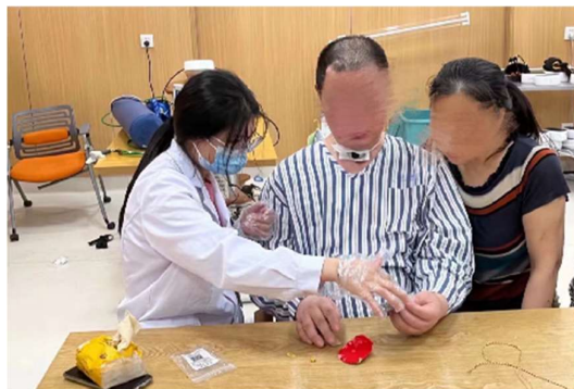
(照顧者參與到小組治療當中)