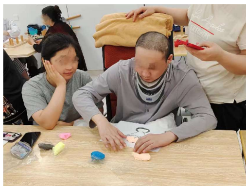
(感覺障礙訓練小組)