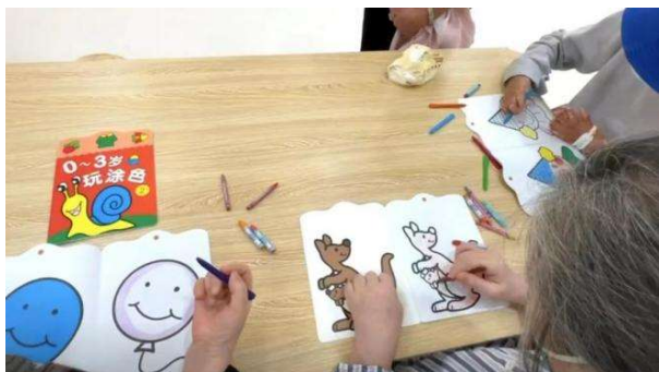
(手功能障礙治療小組)